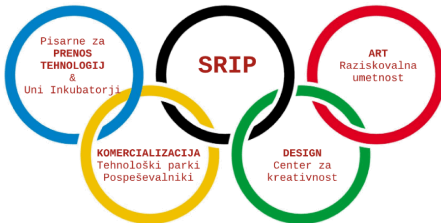
Slika 3: Shema inovacijskega podpornega okolja