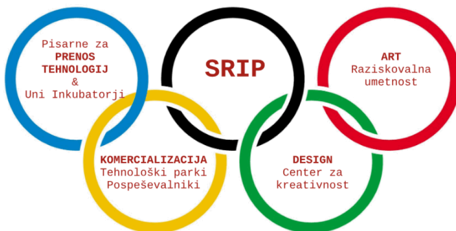
Slika 3: Shema inovacijskega podpornega okolja