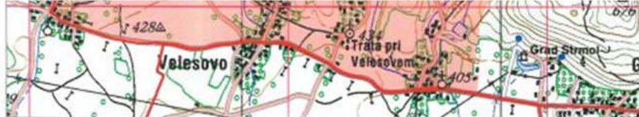
Slika 1: Karta novo deljenega dela lovišču Krvavec iz LPN Kozorog Kamnik