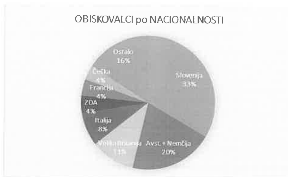
Slika 1: Obiskovalci kobilarne po državah