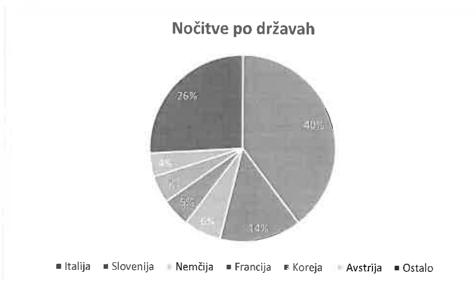
Slika 2: Hotelski gostje po državah

Za hotelsko dejavnost je najpomembnejše italijansko tržišče s 40 %, pri n katerem gre večji delež tudi na račun casino gostov. Sledi slovensko tržišče s 14 %, nemško tržišče s 6 % ter tržišči Francije in Koreje s po 5 %.