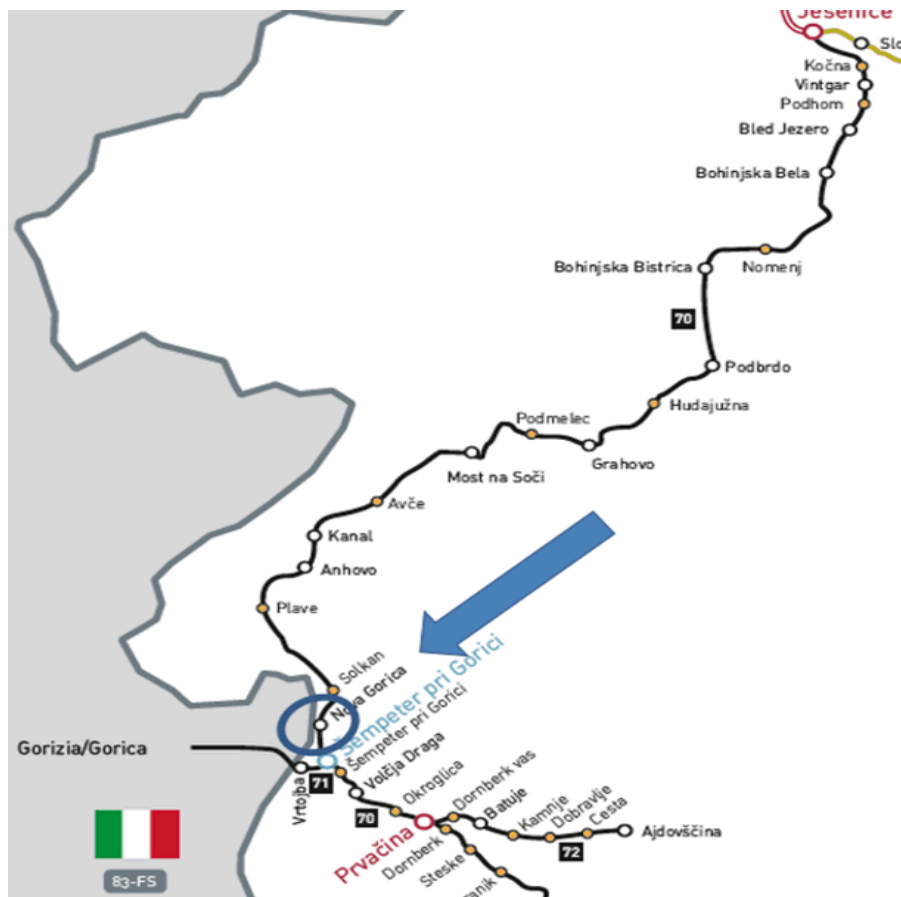
Slika: Položaj projekta v prostoru

Celotna investicija je ocenjena na 33.919.911,00 evrov. Izvedba investicije bo predvidoma potekala do leta 2025. V letu 2022 bodo sredstva potrebna za financiranje izdelave izvedbenega načrta, projektne in investicijske dokumentacije ter izvajanje inženirskih storitev in storitev upravljavca javne železniške infrastrukture.